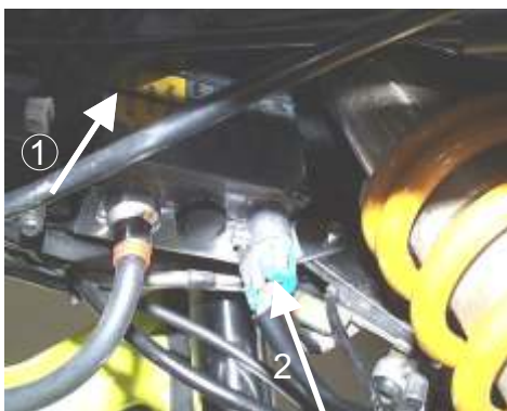
Blick von unten in den Lenkkopf (Federbeinaufnahme) Bild 2

Extraiga el enchufe de la bocina y suelte la bocina junto con la chapa de sujeción (una tuerca SW 13) ab. Retire por favor la sujeción de cable en (1) en la parte derecha del bastidor. La sujeción del aparato de montaje del faro Xenon se inserta después desde abajo en el lado derecho (en el sentido de la marcha junto a la pata telescópica). Las ranuras para los cables que hay en el soporte deben estar hacia abajo (ver Foto 2). Se introduce por el orificio superior (2) el tornillo de goma M5x25 (o LiKo M5x20) y por la otra perforación el tornillo con hexágono interior M5x20 (o M5x16) desde dentro hacia fuera y se sujeta exteriormente con una arandela U grande M5 y una tuerca con sombrerete. Para ello posicionar primero los dos tornillos y fijar la tuerca con sombrerete en (2) fuertemente. Se adjuntan siempre tornillos de dos longitudes para poder compensar las tolerancias.