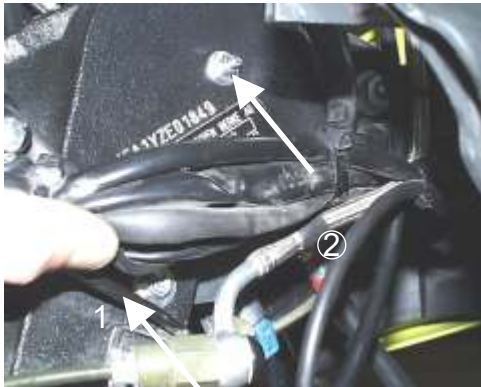
Blick auf Rahmen (Lenkkopf) Bild 1

¡Atención realizar todos los trabajos con el motor apagado!